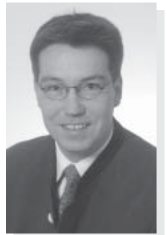
Otto Lederer Erster Bürgermeister